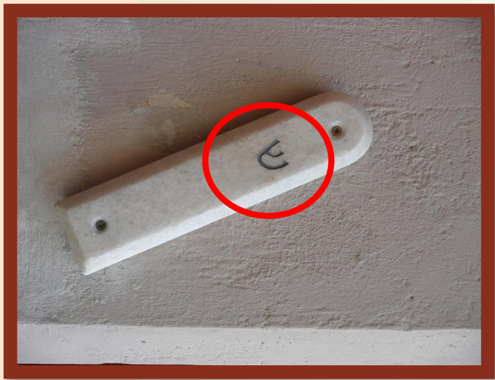
猶太人住家門框上的小盒子— 經文盒 (Mezuzah)